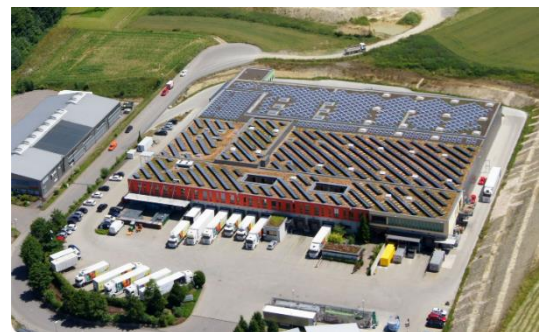
Ein Vorreiter für PV & Gründach ist der Naturkost-großhandel BODAN in Überlingen.

Der voranschreitende Klimawandel erfordert eine Neuausrichtung unserer Gebäude. Gründächer sorgen im Sommer für angenehm kühle Raumtemperaturen und tragen somit zur Anpassung an den Klimawandel bei. Überdies bieten sie einen Lebensraum für Insekten und erhöhen die Biologische Vielfalt im innerstädtischen Bereich. Freie Dach- und Fassadenflächen können für die Produktion erneuerbarer Energien mit Photovoltaik genutzt werden. Die Photovoltaik ist ein wichtiges Instrument gegen den Klimawandel und Einkommensquelle zugleich. Besonders lukrativ ist die Nutzung zur Eigenstromversorgung.