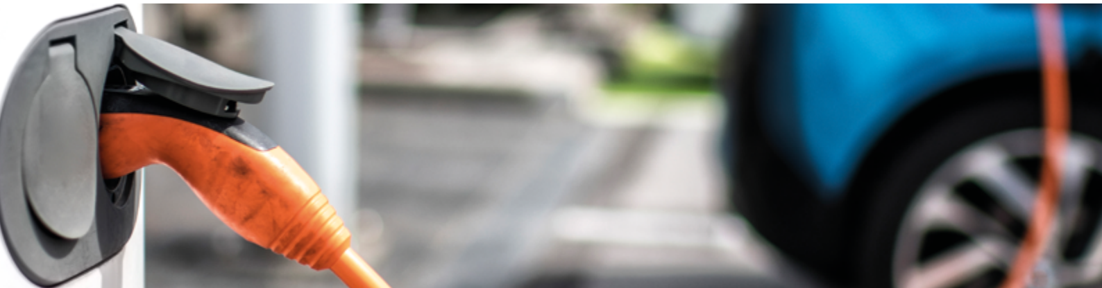
E-Fahrzeug als Speicher