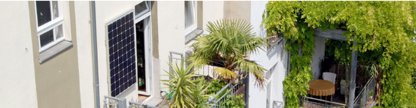
Sonne tanken auf dem Balkon

Immer mehr Menschen interessieren sich dafür: Solarmodule für den Balkon, die man „einfach“ in die Steckdose steckt und somit seinen eigenen Strom produzieren kann. Was verbirgt sich dahinter?