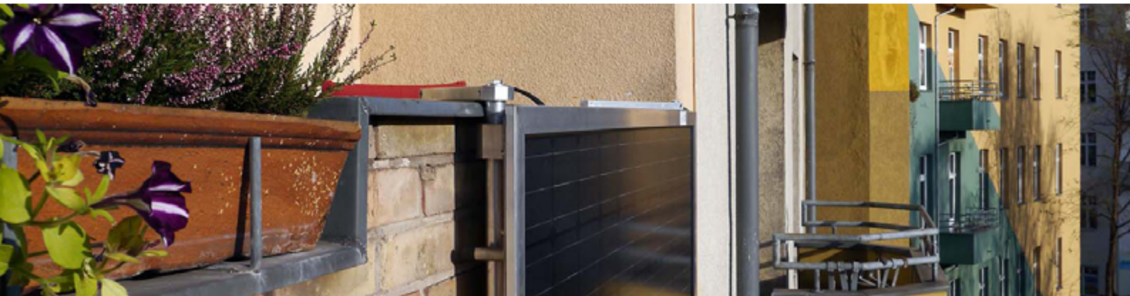
Balkonmodul an der Ballustrade