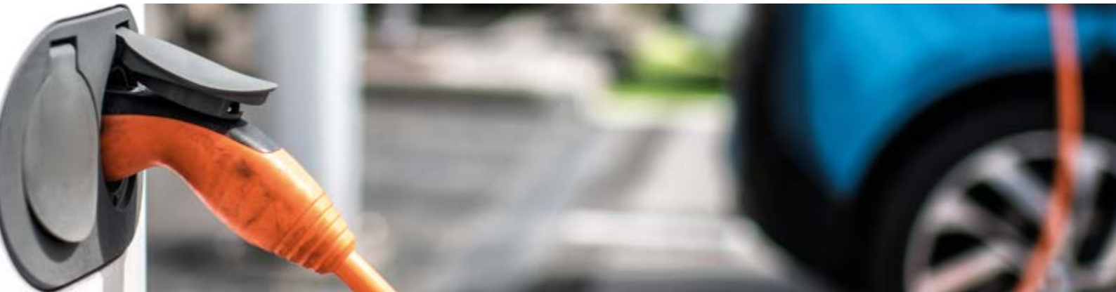
E-Fahrzeug als Speicher